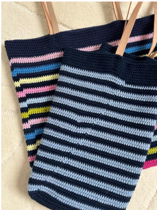
Bild 2: Die blaue Tasche mit abgeschlossenen Runden, die Bunte Tasche mit Spiralrunden gehäkelt.